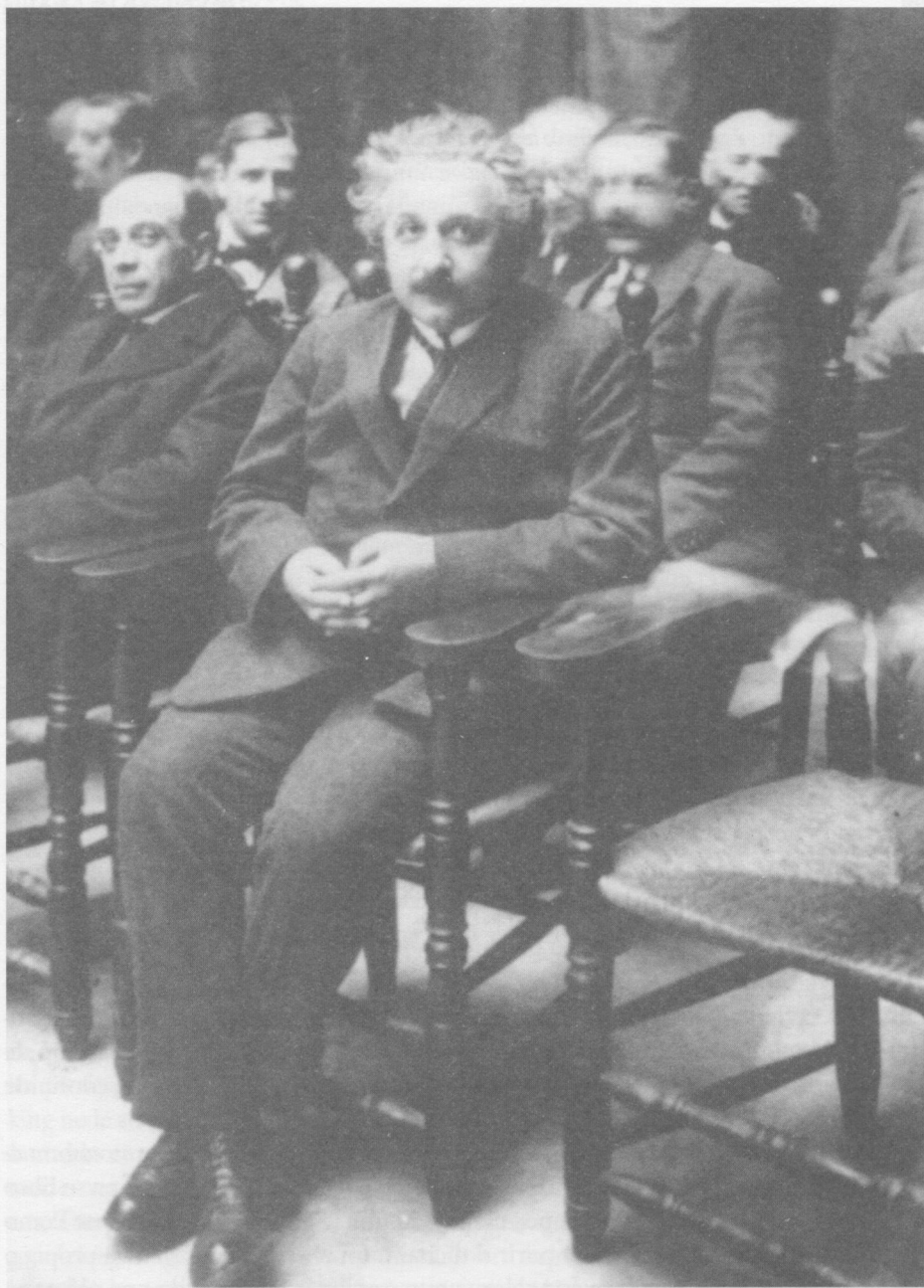
Albert Einstein en la Escuela Industrial de Barcelona, 28 de febrero de 1923.