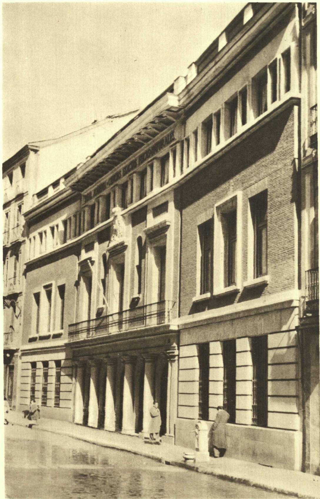
Real Academia de Ciencias de Madrid, (calle de Valverde, n.ºs 22 y 24). Fachada principal.