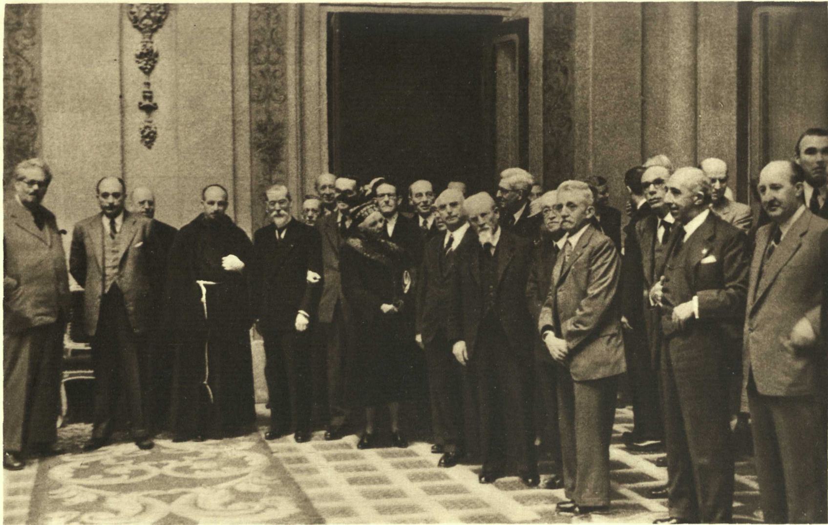
Recepción de los Delegados Extranjeros en el Ayuntamiento de Madrid. 27 de Abril de 1949