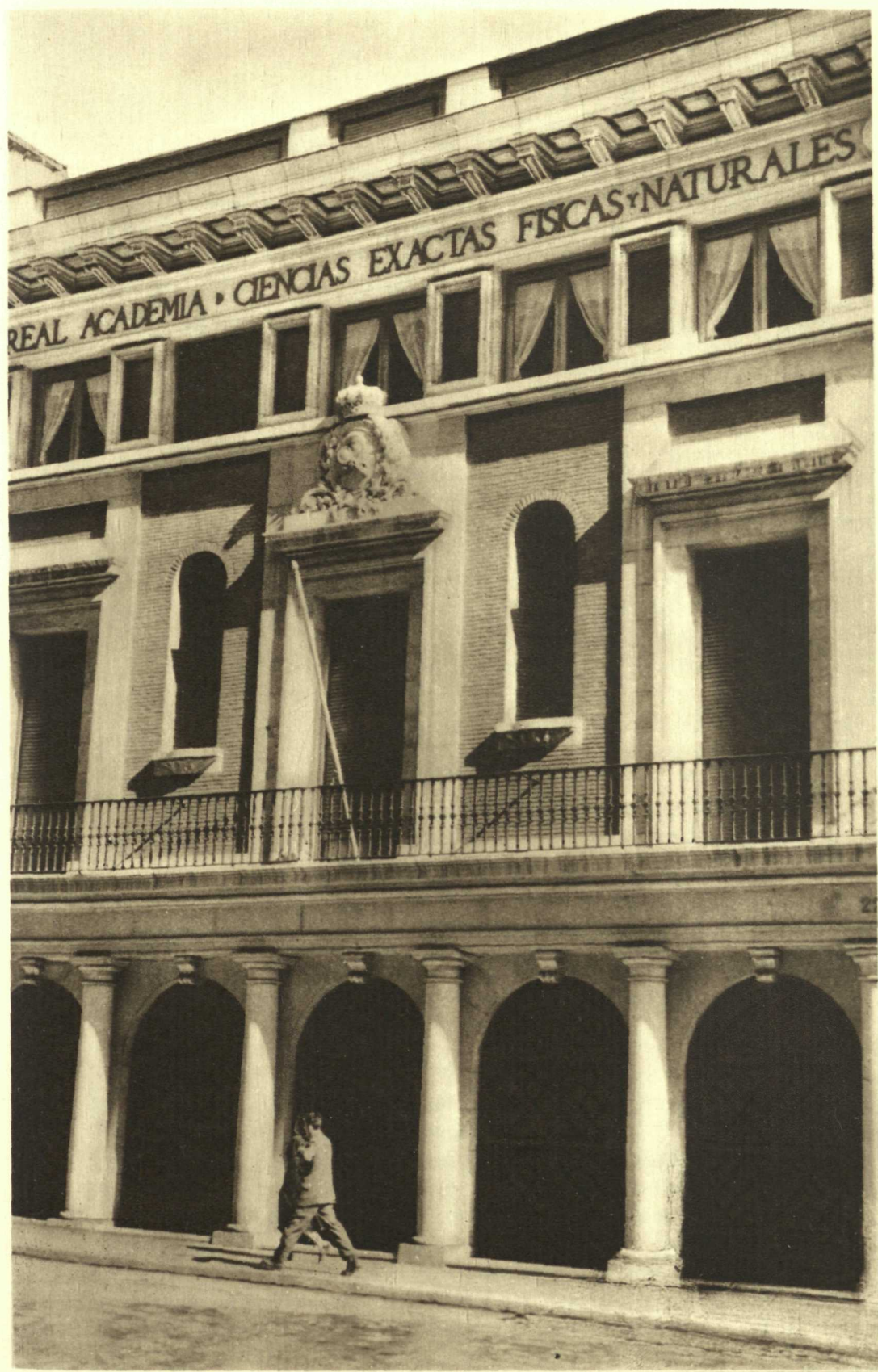
Real Academia de Ciencias de Madrid, (calle de Valverde, n.ºs 22 y 24). Detalle del cuerpo central de la fachada.