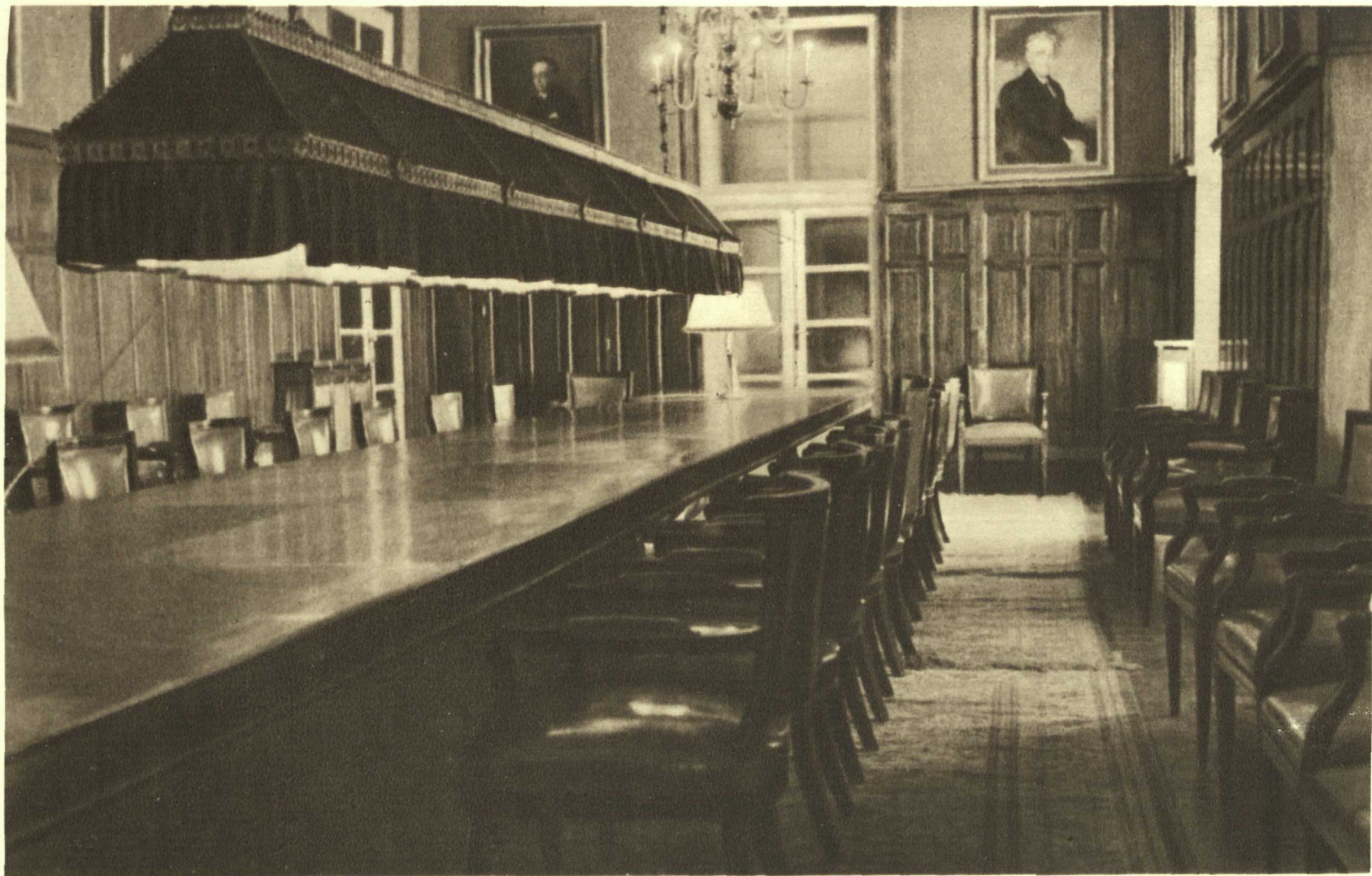
Real Academia de Ciencias de Madrid. Sala de Juntas de los Sres. Académicos.